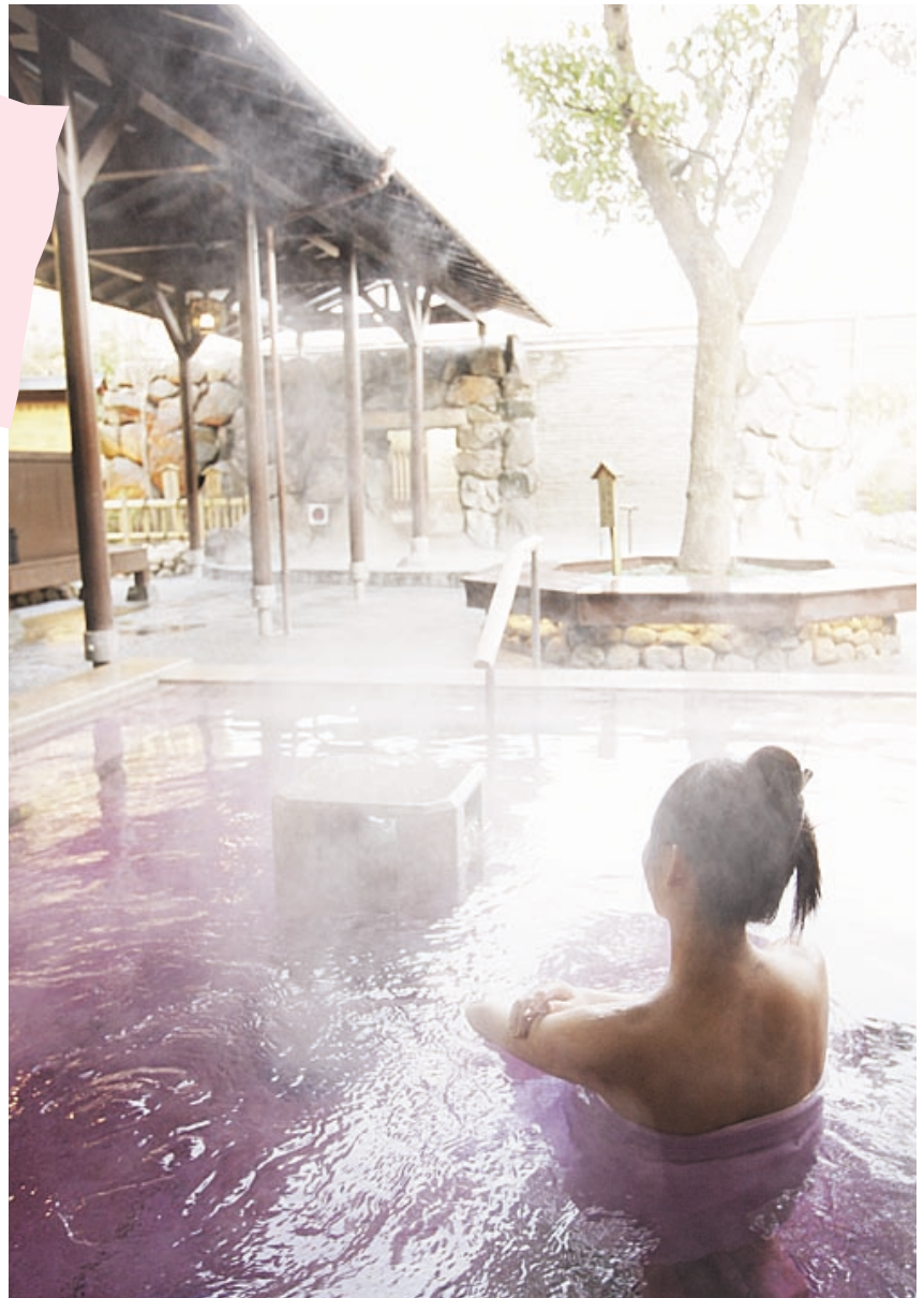
血液サラサラ効果もあると言われる「炭酸泉」。欧州では心臓病や高血圧、冷え性などの治療に利用されている。

お風呂上がりには、「髪剪處」で「フェイスエステ」を体験するのもいい。顔も身体もツルツル、スベスベの肌になれる。